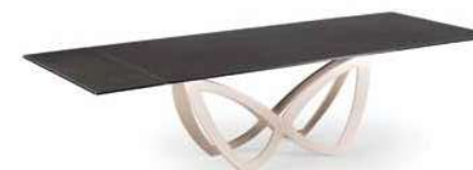
MECHANISM & SUPPORTS CHAMPAGNE – TOPS ANTRACITE