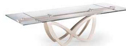
MECHANISM & SUPPORTS CHAMPAGNE – TOPS 08 EXTRALIGHT GLASS