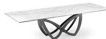
MECHANISM & SUPPORTS BLACK – TOPS CALACATTA