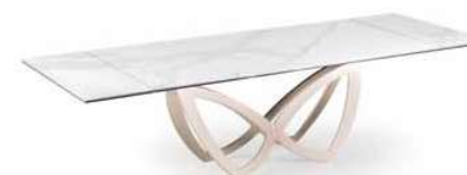
MECHANISM & SUPPORTS CHAMPAGNE – TOPS CALACATTA