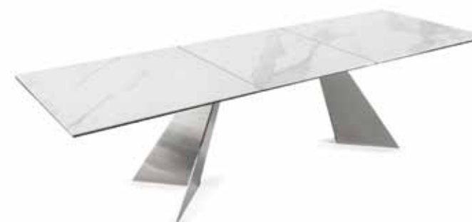
LEGS 34 SATIN NICKEL - MECHANISM 37 CHROME - TOPS WHITE STATUARIO