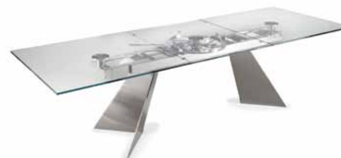
LEGS 34 SATIN NICKEL - MECHANISM 37 CHROME - TOPS GLASS