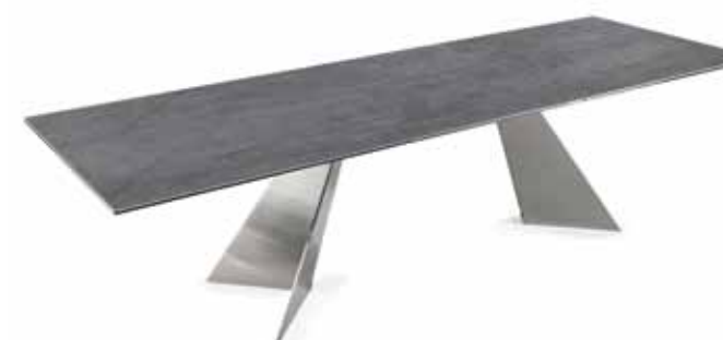
LEGS 34 SATIN NICKEL - MECHANISM 37 CHROME - TOPS STONE SAVOIA ANTRACITE