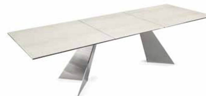
LEGS 34 SATIN NICKEL - MECHANISM 37 CHROME - TOPS STONE SAVOIA PERLA